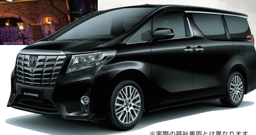
※実際の福祉車両とは異なります